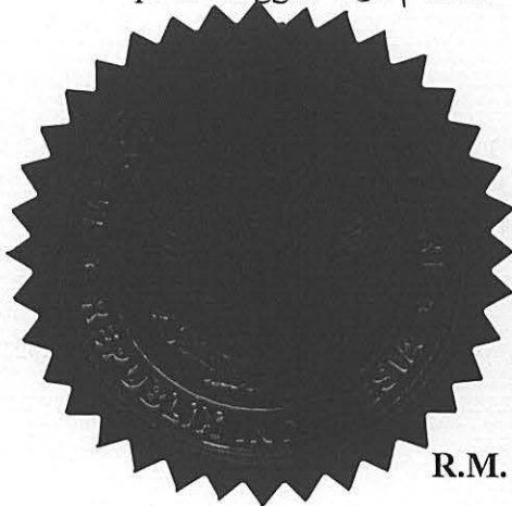
R.M. MARTY M. NATALEGAWA

DIBUAT di Jakarta pada tanggal tiga puluh bulan Mei tahun dua ribu empat belas.